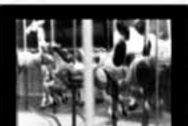
Trois Temps Emma Rodríguez 2'30" / 16mm / 2010