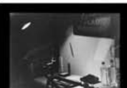
Ride Eliseo Ortiz 2'30" / 16mm / 2011