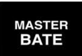
Lloyd_Fein Must Die Charles Lum 3" / Video / 2010