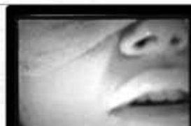
Abortion Jorge Lorenzo 3" / 16mm / 2004