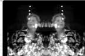
Light is waiting Michael Robinson 11'20" / DV / 2007