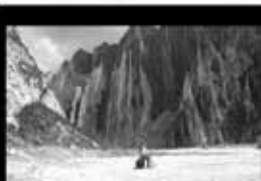
Unísono Daniel Perez 3'14" / VideoHD / 2010