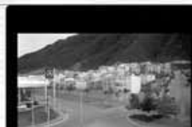
Así es mi tierra (My sweet home land) Oscar Montemayor 2" / S16mm / 2005