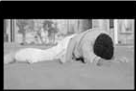
Aire Marcelo Quiñones 3'42" / DVCPRO HD / 2011