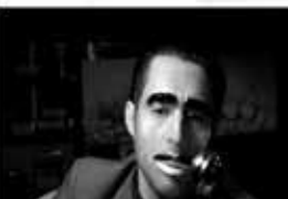
Chats Leo Marz 2'28" / VideoHD / 2010