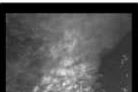
165 segundos Futuro Moncada 165" / Minidv / 2009