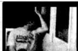
Querelle Eliud Nava 4'50" / video / 2009