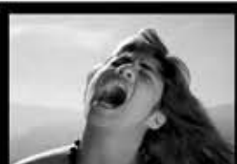
Pesadilla Rodrigo Perales 5'45" / 16mm / 2010